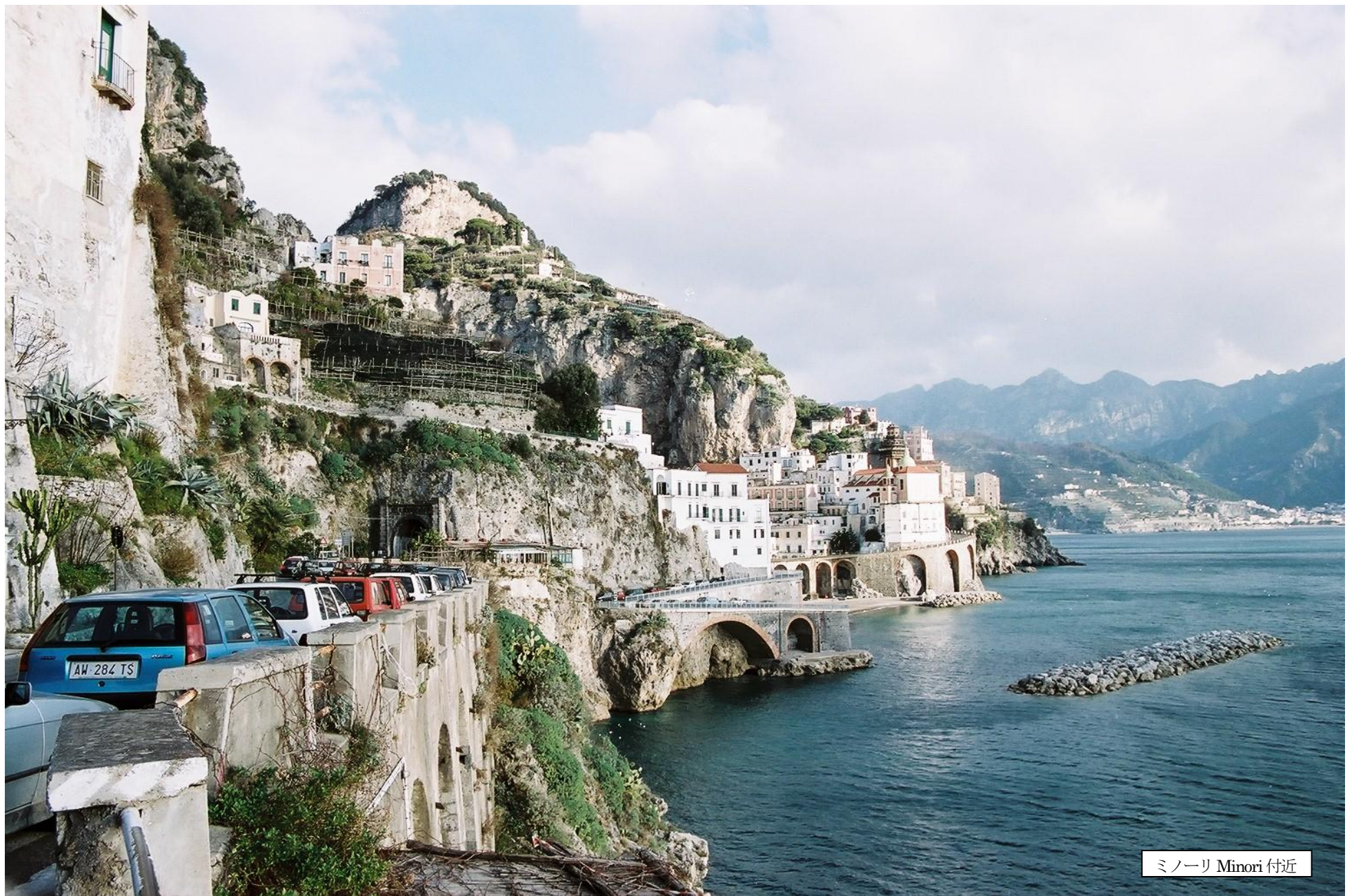
ミノーリ Minori 付近