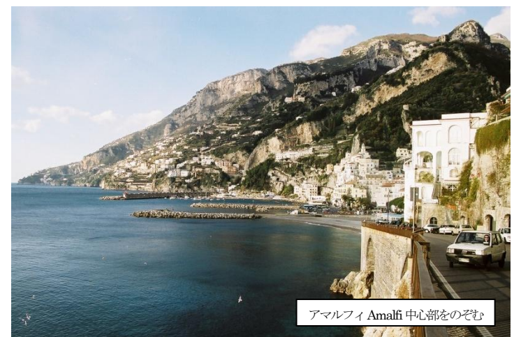
アマルフィ Amalfi 中心部をのぞく