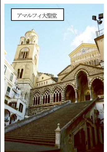
アマルフィ大聖堂

【訪れた感想】美しい海岸線に沿って、美しい集落群が続く海岸はかつて海運王国であった古きイタリアの都市国家の様子を今に伝えている。ただし今となっては単車線の細い道が続く海岸は車の往来がしにくく、快適とは言えない環境ではある。しかしだからこそ、古い建物や教会、そして文化が街の至る所に息づいているかもしれないと感じた。